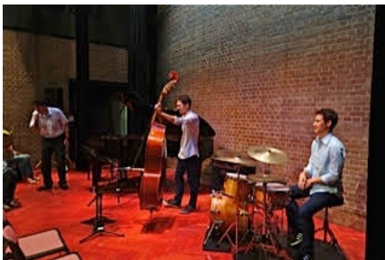
MITプラザジャズワークショップ (鹿角市) 7/16/15