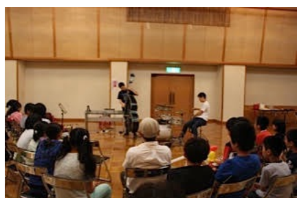
東北大震災秋田避難者イベント（北秋田市）7/25/15