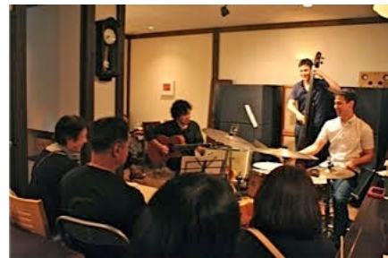
ライブハウスKOW (大館市) 7/17/15