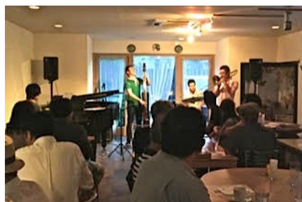
カフェ・ブルージュライブ（秋田市）7/23/15