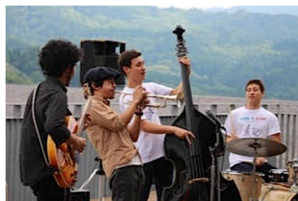
森吉四季美湖ダムライブ（北秋田市）7/24/15