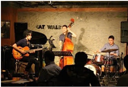
ライブハウス キャットウォーク (秋田市) 7/12/15