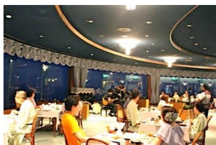
男鹿桜島リゾートきららかディナーショー（男鹿市）7/30/15