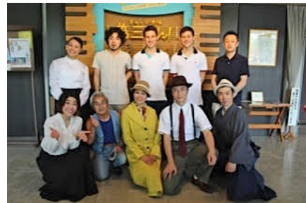
わらび座「為三さん！」観劇後出演者たちと