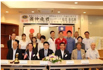
北秋田市ライオンズクラブ国際親善ミーティング