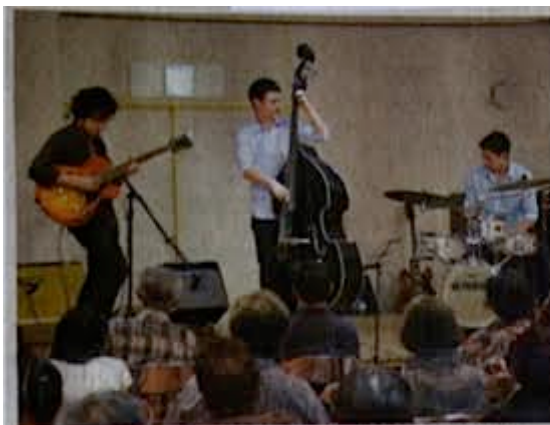
ジャズアレンジされた「浜辺の歌」も演奏したライブ

昨年自主制作したCDに、彼らのためにジャズアレンジされた「浜辺の歌」を所収。作曲者の成田為三が4歳から17歳まで同町仁鮎で暮らした縁で、ゆかりの地・ニッ井での公演となった。