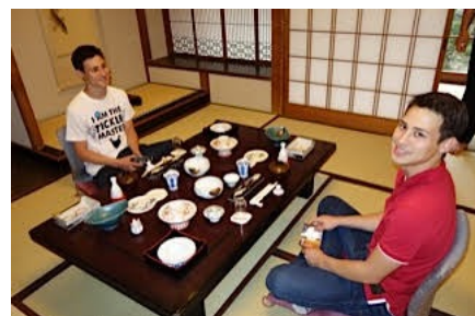
能代市料亭金勇見学