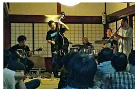
奥羽山荘あか松庵 (大仙市) 7/22/15