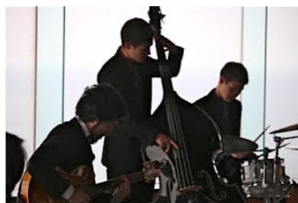
男鹿桜島リゾートきららかランチショー（男鹿市）7/30/15