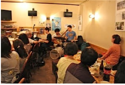
樹音感謝デー（北秋田市）8/1/15