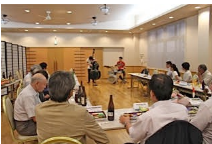
北秋田市ライオンズクラブ総会 (北秋田市) 7/21/15