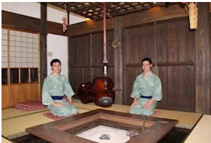
奥羽山荘あか松庵