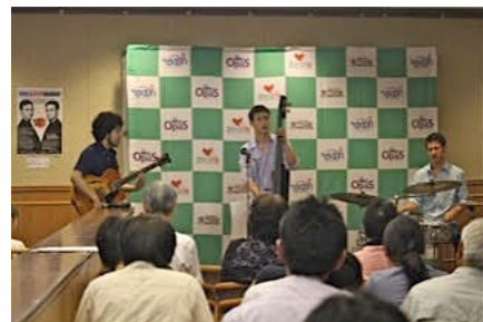
太平山リゾート・ザ・ブーン (秋田市) 7/19/15