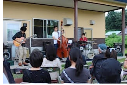
藤里レスポワール大空市（藤里町）8/2/15