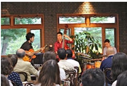
北欧の杜パークセンターコンサート (北秋田市) 7/18/15