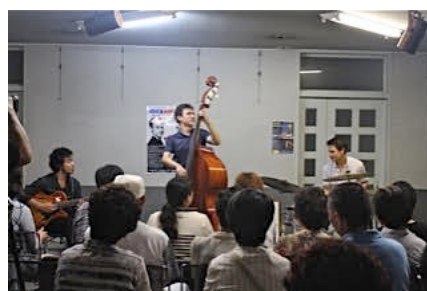
まちなかトライブ（北秋田市）7/31/15