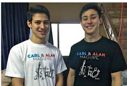
カール&アランデザインオリジナルTシャツ