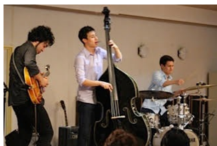
ニツ井公民館コンサート（能代市）7/29/15