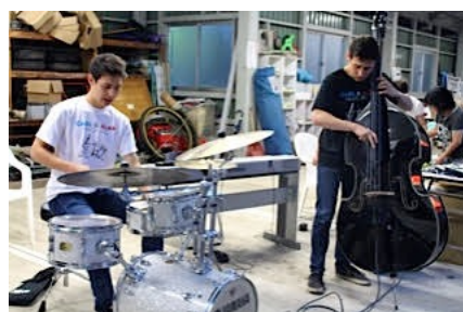
阿仁なつまつり(北秋田市) 7/25/15