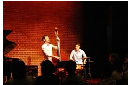
MITプラザコンサート (鹿角市) 7/16/15